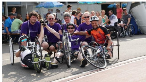
Das Englische (violette Shirts) und Schweizer Handbike Team (2017)

Sponsorenlauf: Der diesjährige Sponsorenlauf zu Gunsten unseres Vereins findet am Dienstag 19. Juni ab 16.30 Uhr auf der Leichtathletik Anlage in Nottwil statt. Wie die vergangenen Jahre auch, werden wir wieder die 1'000 km Handbike Stafette von London nach Nottwil durchführen. Mit einer zusätzlichen Werbeaktion am SPZ Nottwil und einer Bar mit typisch karibischen Drinks, versuchen wir unseren Anlass noch attraktiver zu machen.